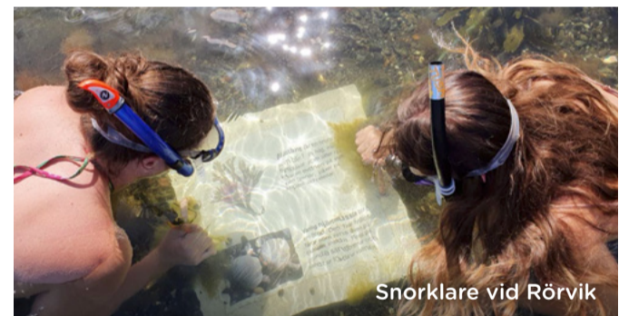
Snorklare vid Rörvik

De stora svarta stråk du kan se är diabasgångar som skär genom klippan av gnejs. Ränderna kallas ibland Hin håles harvedrag – enligt sägnen kom de till genom att djävulens dragdjur slet sig under plogningen och skrapade berget.