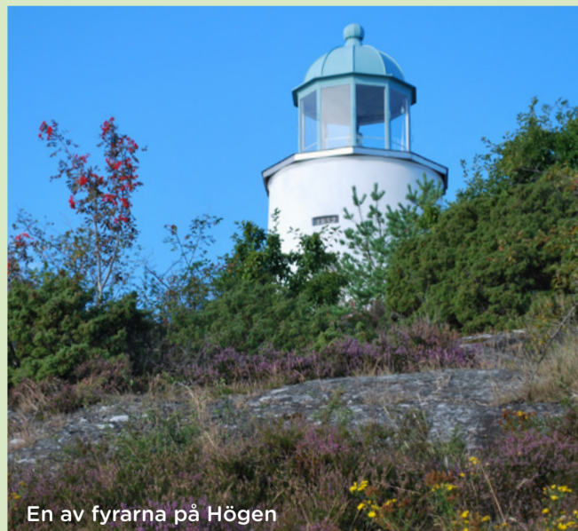
En av fyrarna på Högen

Från Ramnefjäll på Sydkoster får du en fin vy över Kusterskärgården och Kosterhavets