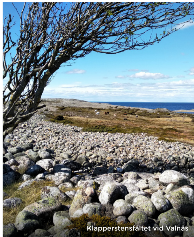
Klapperstensfältet vid Valnäs