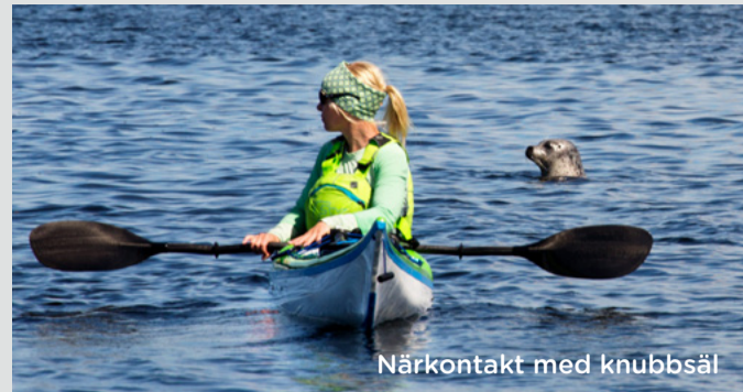
Närkontakt med knubbsäl

...surrar ängarna och hagarna av bin och fjärilar. I buskagen blir insekter mat åt ärtsångarens och törnskatans ungar. Under hög- och sensommaren blommar martorn. Kom ihåg att både martorn och orkidéer är fridlysta och inte får plockas.