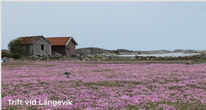
Trift vid Långevik