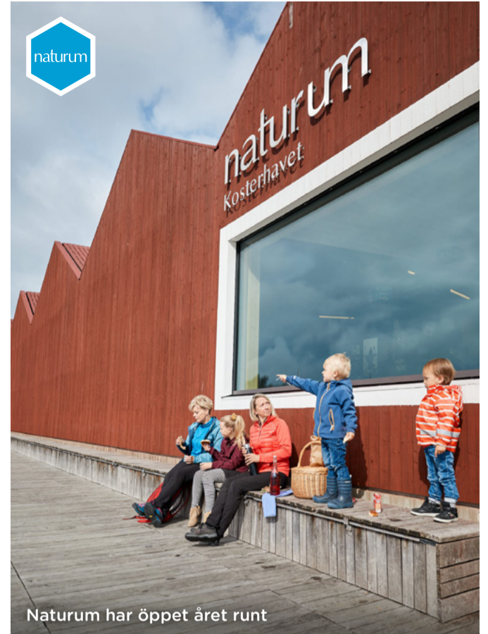
Naturum har öppet året runt