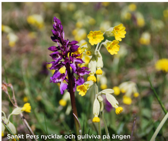
Sankt Pers nycklar och gullviva på ängen

Nästången är en kulturhistoriskt värdefull miljö, med en natur som är typisk för Koster. Klippor och hållmarker täcks av blommande ljung om hösten. På våren lyser ängen av gullvivor och orkidén Sankt Pers nycklar. På skyltarna vid ängen kan du läsa om hur miljöerna en gång formades av det gamla kustjordbruket. Markerna har restaurerats och idag sköts ängen som man gjorde förr.