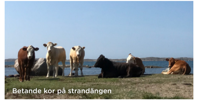
Betande kor på strandängen

Från Breviks hamn viker leden av upp på berget och in i barrskog. Vid Bölebackarna finns en slätteräng med en rik mångfald av blommor som rödklint och slätterblomma. På skylten kan du läsa mer om ängen och hur den sköts.