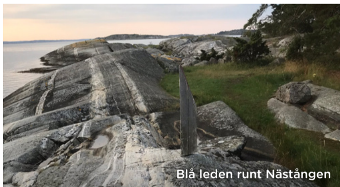
Blå leden runt Nästången

Vid Ekenäs hamn ligger naturum Kosterhavet, ett besökscentrum som även fungerar som nationalparkens huvudentré. Här kan du ta del av utställningar och filmer om några av de 12 000 arterna i området. Det finns också ett klappakvarium där du kan lära känna några vattenlevande djur och alger. Naturum anordnar aktiviteter, guidningar och föreläsningar – och allt är gratis. Personalen svarar gärna på frågor och kan tipsa om besöksmål i naturen.