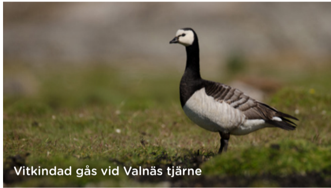
Vitkindad gås vid Valnäs tjärne

På strandängarna och vid de små tjärnarna i Valnäsbukten rastar flyttfåglar. En del arter väljer att stanna här och föda upp sina ungar. Vid tjärnarna är risken att trampa i ett fågelbo eller skrämma ungarna lite större, så håll dig på leden.